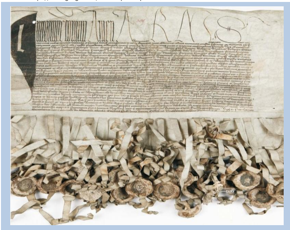
Dokument - Układu w Horodle