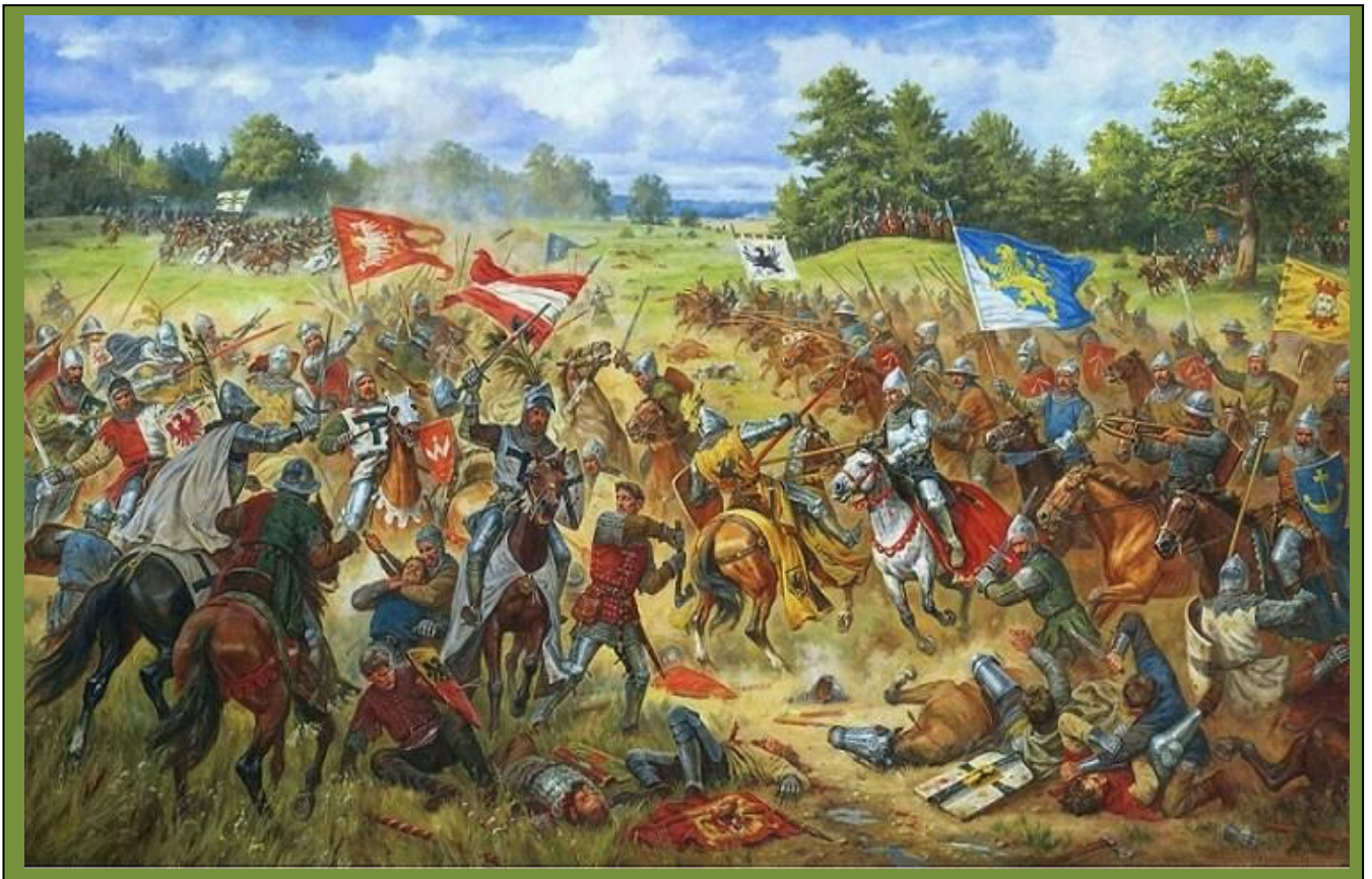
Ob. Artur Orlonow, „Chorągiew lwowska w bitwie pod Grunwaldem”.

Na czele wojsk krzyżackich stał Wielki Mistrz Ulrich von Jungingen.