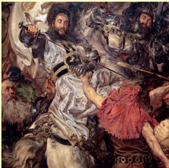
Wielki Mistrz Ulrich von Jungingen

W swoich „Rocznikach” Jan Długosz tak zapisał treść tego poselstwa „Najjaśniejszy królu! Wielki mistrz pruski Ulryk posyła tobie i twojemu bratu przez nas tu obecnych posłów dwa miecze, ku pomocy, byś z nim i z jego wojskiem mniej się ociągał i odważniej, niż to okazujesz, walczył, a także żebyś się dalej nie chował i pozostając dalej w lasach i gajach, nie odwlekał walki. Jeżeli zaś uważasz, że masz zbyt ciasną przestrzeń do rozwinięcia szeregów, mistrz pruski Ulryk by cię przynęcić do walki, ustąpi ci, jak daleko chcesz, chcesz równiny, którą zajął swoim wojskiem, albo wreszcie wybierz jakiegokolwiek pole bitwy, byś dalej nie odkładał walki”.